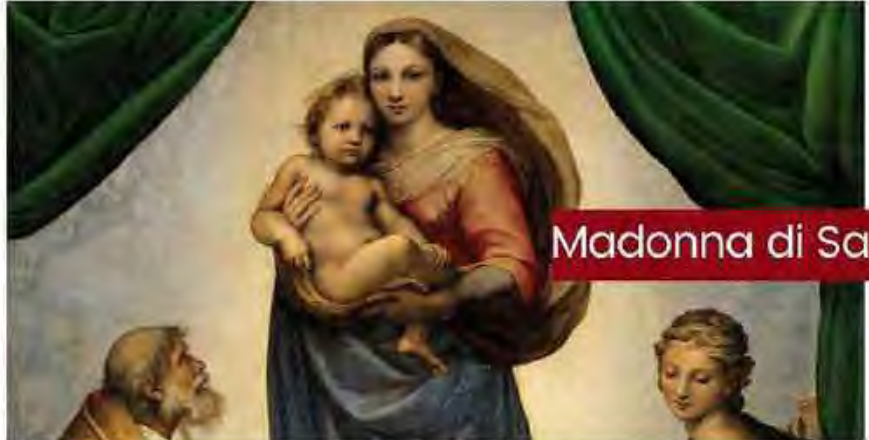
Madonna di San Sisto

1500 yılında Pietro Vannucci adında bir ressam, Raphael'i Umbria bölgesindeki Perugia'da çırakı olmaya davet etti. Bu dönemde, eserleri genellikle Perugino'dan etkilendi. Bu etki altında 1504'te yaptığı son resim "Kutsal Bakire'nin Evliliği" ile dikkat çekti. 1504 yılında Rönesans'ın merkezi ve onun etkilediği sanatçıların yaşadığı yer olan Floransa'ya taşındı. Leonardo da Vinci ve Michelangelo' dan esinlendi ve sanatına yenilikler kattı. Raphael'e göre bu yenilikçi sanatçılar, sanatlarında yeni bir derinlik seviyesi ve kompozisyona sahipti. Onların çalışmalarının detaylarını inceleyen Raphael önceki resimlerine göre daha da karmaşık ve etkileyici kişisel bir tarz geliştirebildi. 1504'ten 1507'ye kadar Raphael, "Madonnalar" serisini yaptı.